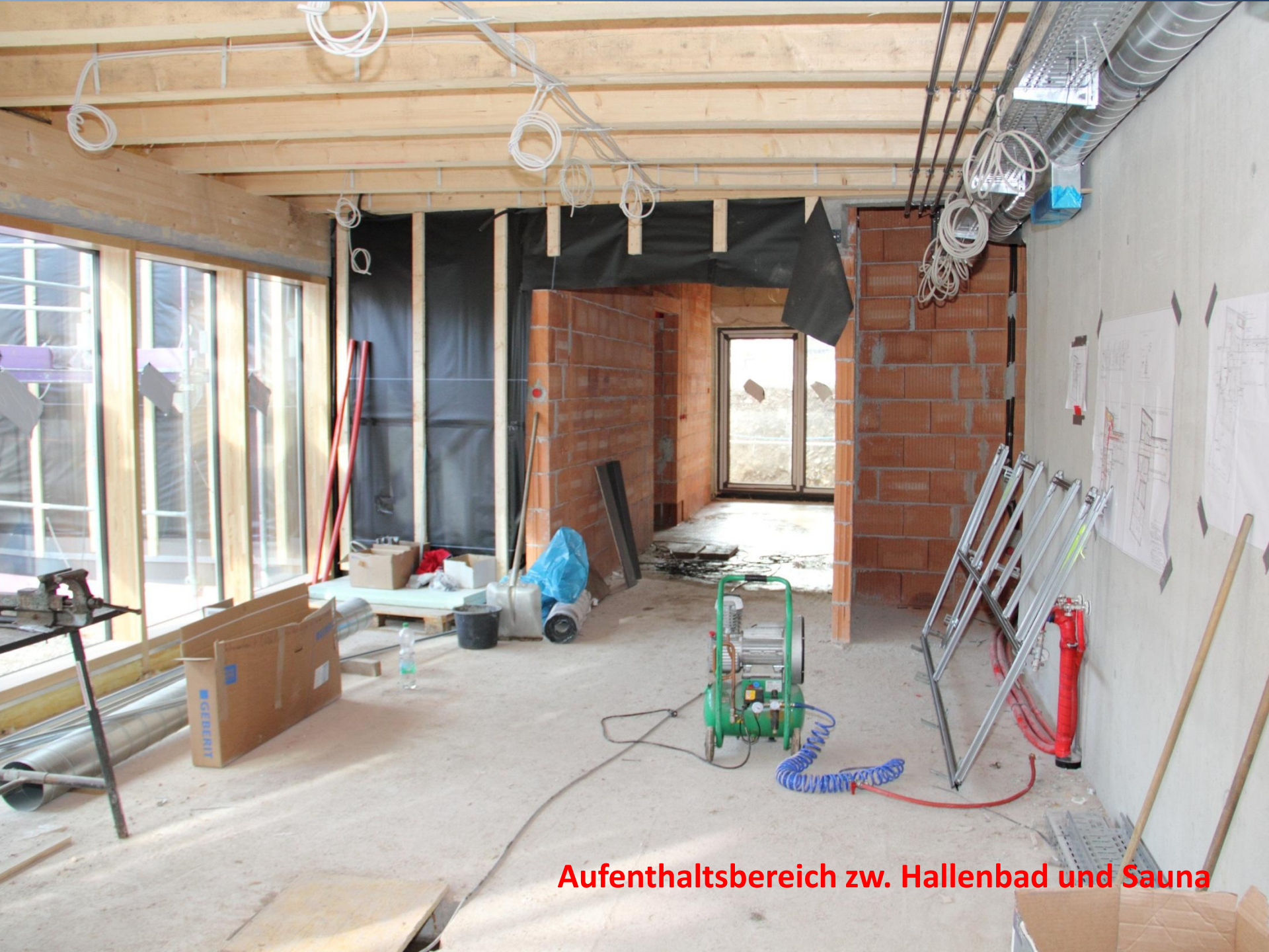
Aufenthaltsbereich zw. Hallenbad und Sauna