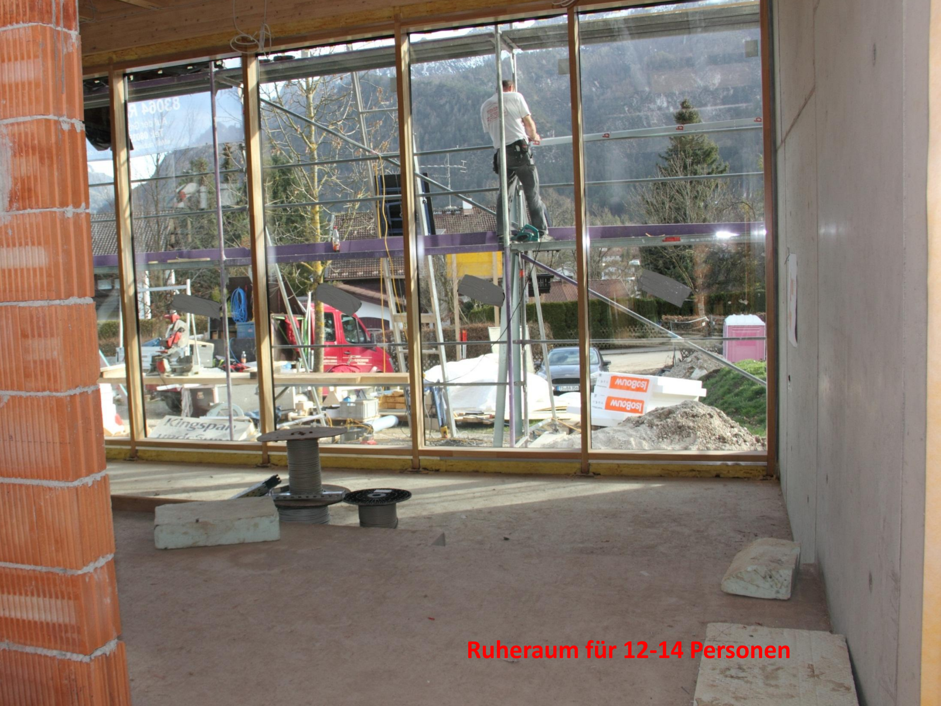
Ruheraum für 12-14 Personen