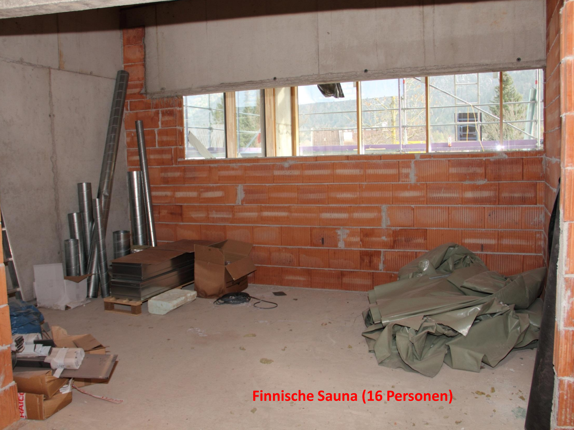
Finnische Sauna (16 Personen)