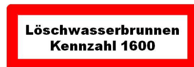
Bild 2 nach DIN 4066 D1 Empfehlung des LFV Bayern