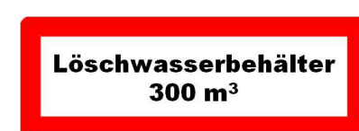
Bild 4 nach DIN 4066 D1 Empfehlung des LFV Bayern