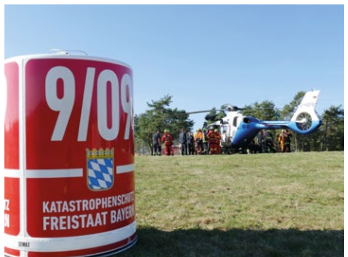
Polizeiubschrauber EC135 mit Semat 900