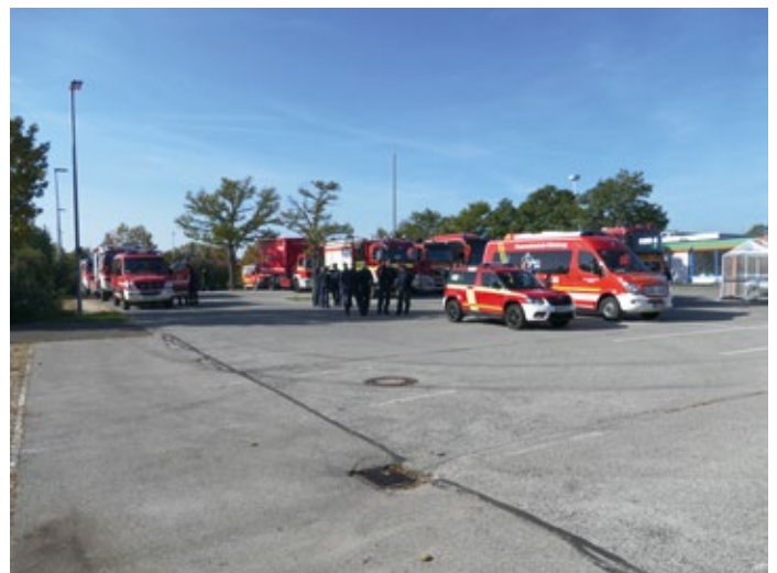
Bereitstellungsraum in Amberg

Im Übungsgebiet wurde zwei Tage die Luftarbeit geübt. Zunächst wurde eine direkte Brandbekämpfung mittels Löschwasserbehälter durchgeführt. Danach konnten Kräfte und Material in das Brandgebiet geflogen werden. Diese wurden zum Teil an der Winde des Hubschraubers in das Schadensgebiet gewünscht. Als dritten Schritt wurden die Kräfte mit Material und Löschwasser aus der Luft versorgt. In der Folge wurde im Wechsel eine direkte Brandbekämpfung aus der Luft durchgeführt und der 3000 Liter Falbehälter vor Ort gefüllt, um die Bodenkräfte zu unterstützen. Ein Austausch und die Versorgung der Mannschaft in den verschiedenen Positionen konnte mehrmals durchgeführt werden, um einen kontinuierlichen Informationsfluss auch über einen Wechsel der Kräfte hinweg zu üben.