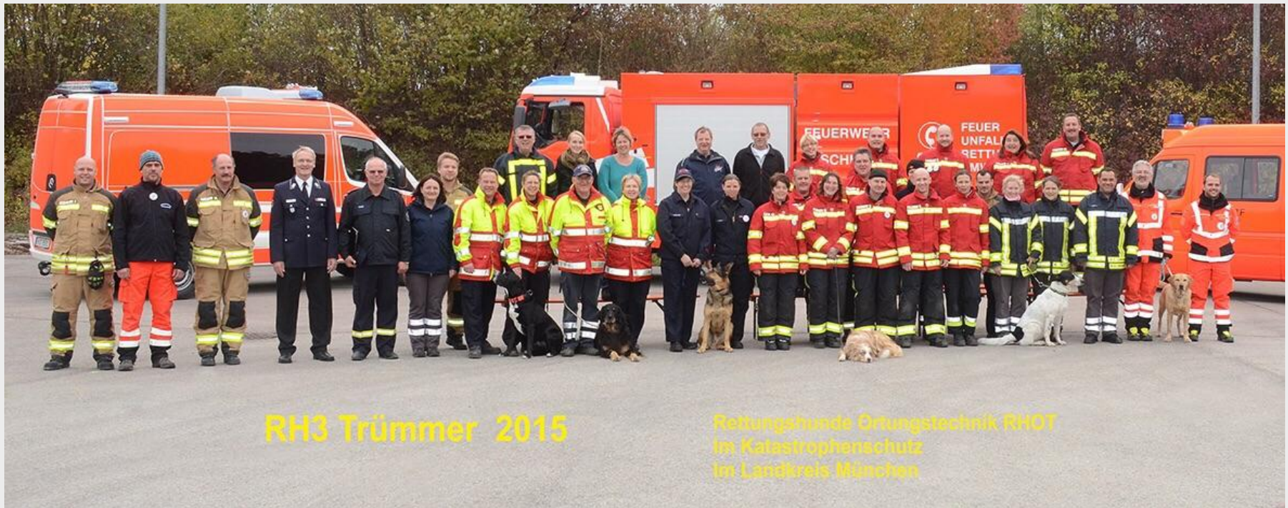
RH3 Trümmer 2015